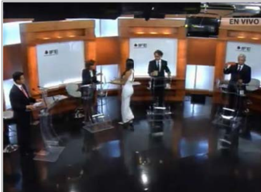
QUADRI VIENDO EL TRASERO DE JULIA