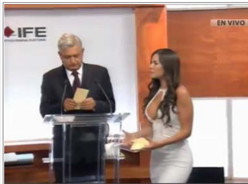
AMLO: "Serenio Moreno"