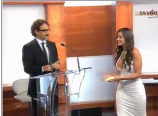
JULIA SE RETIRA Y QUADRI LA MANTIENE EN LA MIRA. NO VE NI QUÉ LETRA LE TOCÓ.