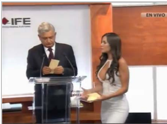
AMLO: "Serenó Moreno"